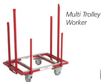
Multi Trolley Worker