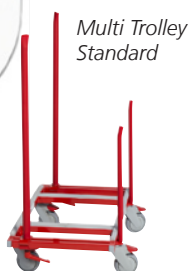
Multi Trolley Standard